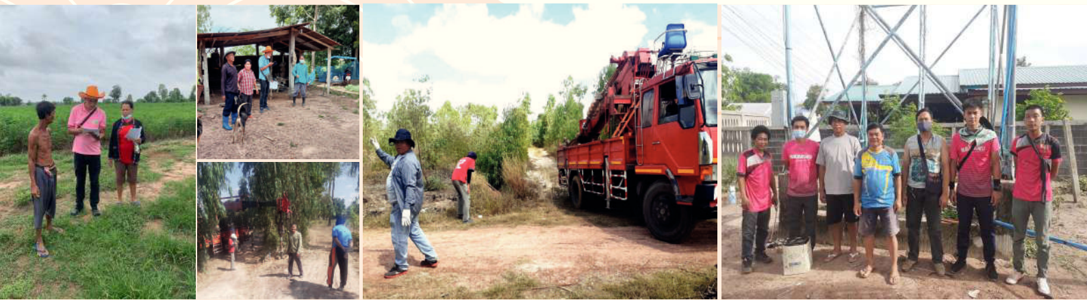
ซ่อมแซมระบบประปา สำรวจประมาณราคาและขยายเขตไฟฟ้า